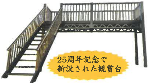
25周年記念で新設された観賞台