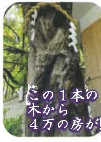
この1本の木から4万の房が