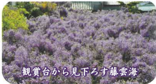
観賞台から見下ろす藤雲海

そして現在、梶本家の庭では、樹齢45年になる“1本”の野田藤が「藤保存会」の手で守られ、この春も、幅30m、奥行き27mの藤棚に4万を超える花房をつけようとしています。薄紫の華麗な花房と高貴な香りが、皆様をお待ちしています。その優雅な空間に、ゆったりと浸り、癒され、ぜひパワーをもらってください。