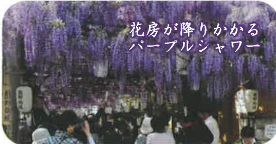
花房が降りかかるパープルシャワー