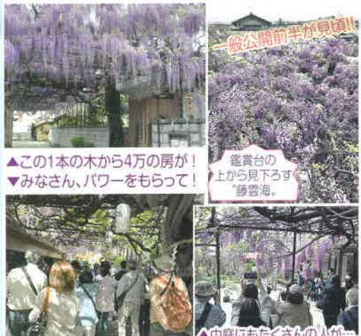
▲この1本の木から4万の房が! ▼みなさん、パワーをもらって!