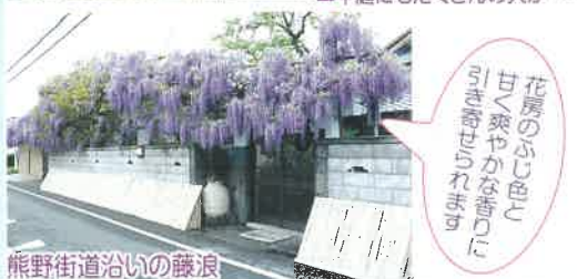
熊野街道沿いの藤浪